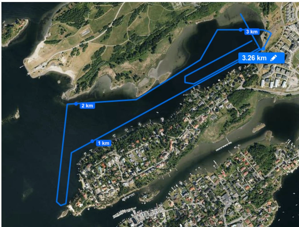
Kartskisse over banen i Koksabukta på Fornebu utenfor Oslo